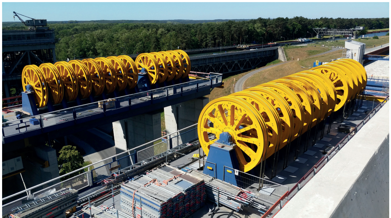
视图中的一部分，共安装了112个双电缆滑轮。背景中是旧的船舶提升机。

西马格特宝格集团将其几十年来在竖井提升中的配重系统的经验贡献给了这个项目。在新的提升机中，填充的槽体挂在224根60mm直径的钢缆上。通过112个直径为4米的双电缆滑轮与两侧的配重组连接。