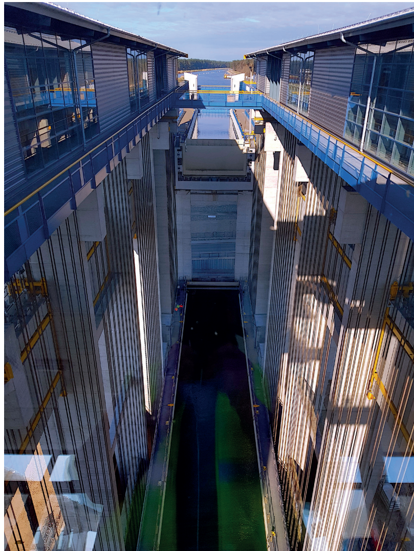
槽内钢缆作为槽与配重之间的连接件的视图。

这样一来，36米的提升高度约为3分钟，而旧式提升机的行程时间约为5分钟。对于可能发生的事故情况，类似于旧的提升机安装的槽式安全系统，由四个带内螺纹柱的旋转螺栓组成，连接在塔架处，在过度失衡的情况下，将牢牢地固定住船槽。